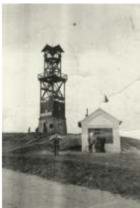
Rozhledna na Hlíně z roku 1910

Na Hlíně stávala také další třípodlažní rozhledna na kótě 449 m. V roce 1939 byla zpevněna a zvýšena na pět podlaží. Vypráví se, že z ní byla vidět věž Štěpánského domu ve Vídni. Tato rozhledna triangulačního bodu byla zbořena v roce 1944.