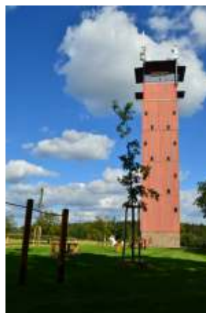
Rozhledna Vladimíra Menšíka