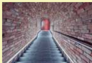
Sklep Na Vyhlídce

Kde: Palackého náměstí, Ivančice Prodej burčáku od místních vinařů. Řemeslné trhy, kulturním programem. V sobotu Grilfest.