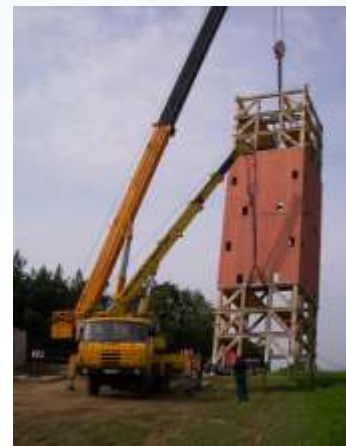
Stavba rozhledny 2006

Klub českých turistů, spolu s představiteli města Ivančice a obce Hlína, uspořádali v letech 2002, 2003 a 2004, vždy v měsíci září, pochod a setkání u budoucí rozhledny, kdy informovali přítomné o vývoji stavby a hlavně o získaných finančních prostředcích. Dne 16. května 2005 se začalo se stavbou betonového nosného podstavce rozhledny. Samotná rozhledna se zatím tvořila ve výrobní hale. 24. srpna 2006 se začalo s usazováním rozhledny na betonový podstavec. Krátce po postavení rozhledny se zde konalo páté, poslední, setkání u zatím veřejnosti nepřístupné rozhledny. A tak od postavení nejstarší rozhledny na Hlíně tu po téměř sto letech (přesně po 96 letech) stála nová rozhledna Vladimíra Menšíka na Hlíně.