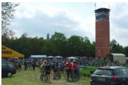
Otevření rozhledny 2007